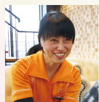
レガロアコンフォート大分中津 入社 4年9ヶ月

今からご予約いただいている方もいらっしゃるので、ご期待に沿えるよう創ってまいります。ご予約お待ちしております。